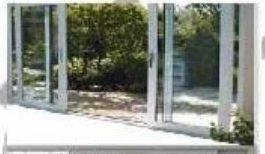
Al/PVC Sliding Doors