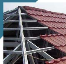
Truss roof/Clay tile