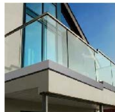
Glass Balcony Railing