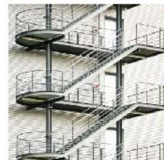
MS Fire Staircase