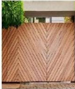
Wood Panel Gate